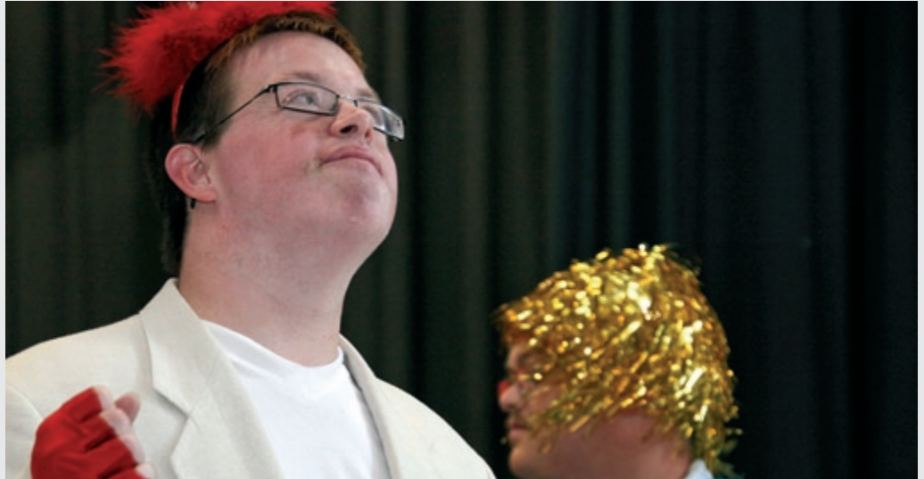
Gingen auf Tournee: das Theaterprojekt „Villa Paletti“

Das selbstbestimmte Leben beginnt schon am Eingang. Denn anders als in Heimen steht der Name der Bewohner an der Klingel. Individuell gestaltete Zimmer gehören ebenso dazu wie die Entscheidung, was eingekauft und gekocht wird. „Damit fördern wir die Individualität, Stärken, Talente und Fähigkeiten der Menschen“, erklärt Margarete Tepper. So lernen sie, Schritt für Schritt ihre eigenen Wünsche zu verwirklichen. Seit 1991 leben acht Erwachsene im Lärchenweg 1 und 3 in einem Wohngebiet in Eitorf. In das Doppelhaus sind Menschen aus der Villa Gauhe gezogen, die im Laufe der Zeit immer eigenständiger wurden. Neben ihrer Berufstätigkeit in den Rhein-Sieg-Werkstätten Eitorf gehört Waschen, Bügeln,