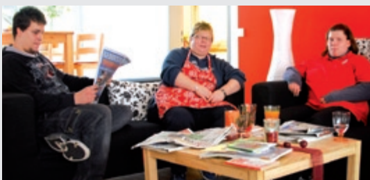
Sich einfach nur wohlfühlen