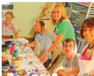
Das Franz Sales Haus in Essen bietet vielfältige Freizeitangebote.

Je nach Art der Behinderung – sei es körperlich, seelisch oder geistig – benötigen sie individuelle Unterstützung. Die persönliche Wohnform ist davon