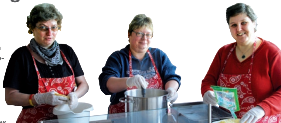
Die Besucher der Halte-Stelle bereiten ihr Mittagessen selbst zu.