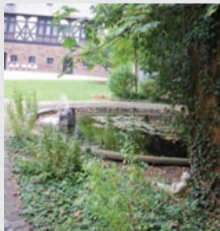
Eine Oase zum Verweilen