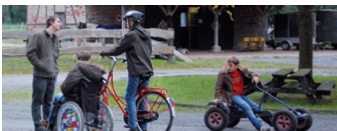
Miteinander ins Gespräch kommen auf dem Laibach-Hof Jugendliche mit seelischer und geistiger Behinderung.

ODILIA e.V. Heuweg 7 – 9 33790 Halle in Westfalen Tel.: 05201 8122-0 www.odilia-gemeinschaft.de