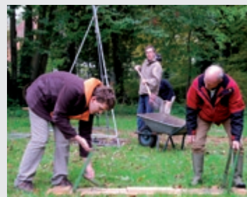
Leben im Rhythmus der Jahreszeiten