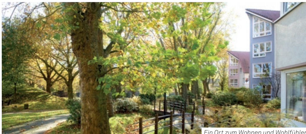
Ein Ort zum Wohnen und Wohlfühlen

Ministerin für Gesundheit, Emanzipation, Pflege und Alter des Landes NRW